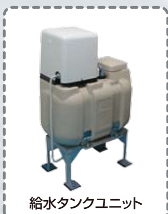
給水タンクユニット