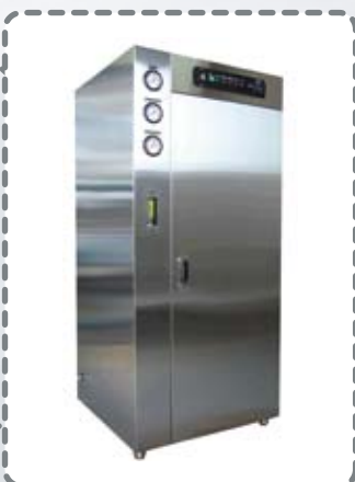
TW-750-XRO ◆ 生産水量 毎時750L