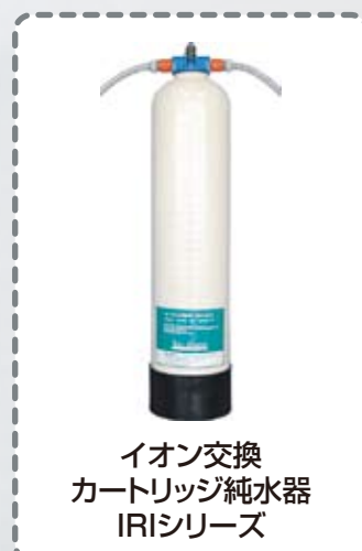
イオン交換 カートリッジ純水器 IRIシリーズ

ROシリーズとIRIシリーズの 組み合わせにより、高純度の純水が 必要なケースに対応します。また、 純水を供給する事で、イオン交換 樹脂の交換頻度が軽減されます。