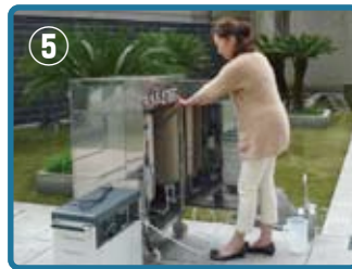
⑤ ボタンを押すだけ簡単操作