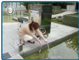
③ 給水チューブを水源へ